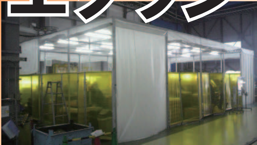
臨時の溶接作業ブース例